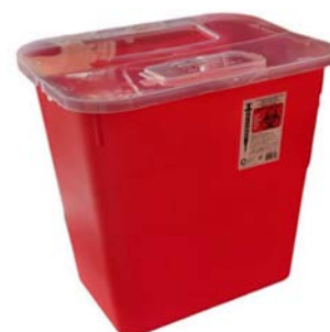
Recolector de punzocortantes Rojo IXIÓN 30 lt Precio: $357.94 SKU: T-RPT302 Presentación: Pieza