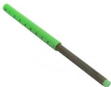
Marcador para piel COVIDIEN Precio: $63.22 SKU: T-31145926 Presentación: Pieza