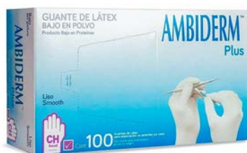
Guante de exploración NO estéril látex AMBIDERM CH M G Precio: $208.8 SKU: T-GLNC01 Presentación: Caja 100