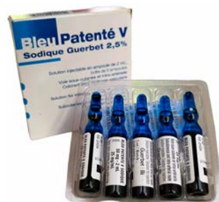
Azul patente 2.0% 2 ml sol iny Precio: $10343.37 SKU: T-AZUPA2 Presentación: 5 amp