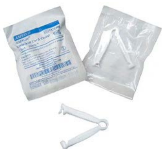
Pinza umbilical estéril UCC100 AMSINO Precio: $12.88 SKU: T-UCC100 Presentación: Pieza