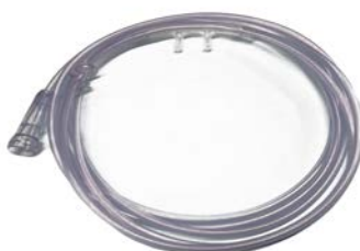
Canula nasal pediátrica 1.8 Mts silicón UNILE- BEN

Precio: $33.29 SKU: T-CNA075 Presentación: Pieza