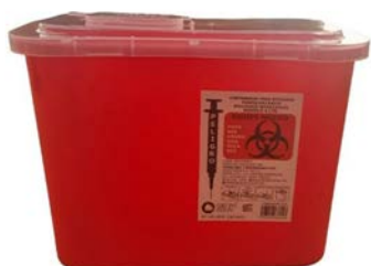
Recolector de punzocortantes Rojo IXIÓN 4 lt Precio: $70.23 SKU: T-RCP004 Presentación: Pieza