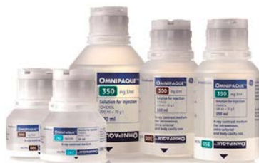
Omnipaque 300/100 ml Precio: $1002.59 SKU: T-OMNI-10 Presentación: Frasco