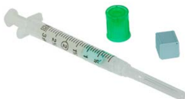
Jeringa para gasometría 3.0 ml 23 x 25 BD Precio: $63.22 SKU: T-364327 Presentación: Pieza