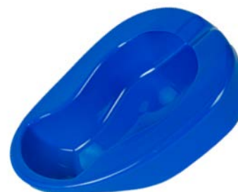
Cómodo para adulto PAAI Precio: $58 SKU: T-H120-05 Presentación: Pieza