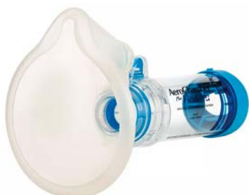
AeroChamber Flow-Vu Plus adulto

Precio: $684.4 SKU: T-AERO001-2 Presentación: Pieza