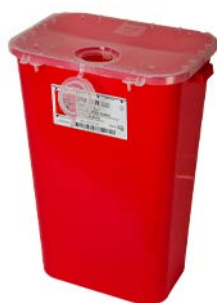
Recolector de punzocortantes Rojo BEMIS 42 lt Precio: $3967.2 SKU: T-CDP010 Presentación: Pieza