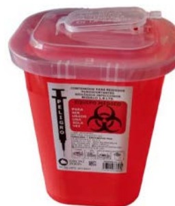
Recolector de punzocortantes Rojo IXIÓN 1.8 lt Precio: $52.33 SKU: T-RPZ18 Presentación: Pieza