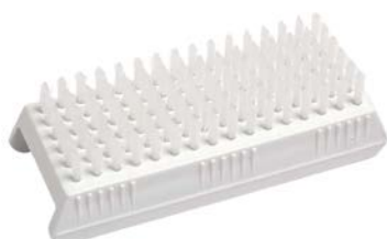
Cepillo plástico para cirujano Precio: $29.46 SKU: T-CPC001 Presentación: Pieza