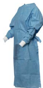
Bata para cirujano estéril 35 gr PAAI Precio: $61.94 SKU: T-MMP-204 Presentación: Pieza