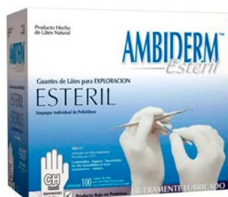
Guante de exploración estéril látex AMBIDERM CH M G Precio: $229.68 SKU: T-LECA01 Presentación: Caja 100