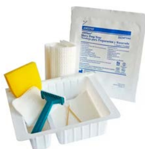
Kit tricotomía AMSINO Precio: $5.68 SKU: T-SPT001 Presentación: Pieza