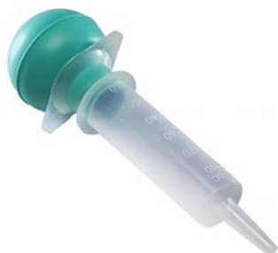
Jeringa asepto 60 ML AS011 AMSINO Precio: $40.25 SKU: T-AS011 Presentación: Pieza