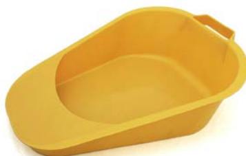
Cómodo ortopédico MEDEGEN Precio: $48.14 SKU: T-H100-05 Presentación: Pieza