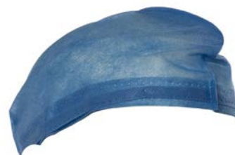
Gorro cirujano GPB050 PAAI Precio: $142.91 SKU: T-GPB050 Presentación: 100 pzas