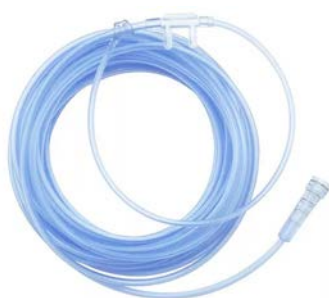
Canula Nasal AD. 7.5 mts T-CNA075 UNILE- BEN

Precio: $72.5 SKU: T-CNA150 Presentación: Pieza