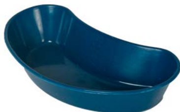
Riñón 700 ml PAAI Precio: $14.27 SKU: T-H310-05 Presentación: Pieza