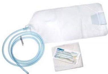
Bolsa para enema con jabón y campo AMSINO Precio: $44.54 SKU: T-AS330 Presentación: Pieza