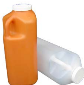
Recolector de orina 3lt MEDEGEN Precio: $63.68 SKU: T-ROL001 Presentación: Pieza