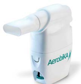
Ejercitador presión posi- tiva Aerobika

Precio: $5.68 SKU: T-EOX015 Presentación: Pieza