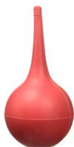
Jeringa pera de hule No.6 ARFAM Precio: $32.25 SKU: T-JPH06 Presentación: Pieza