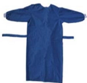
Bata desechable para cirujano reforzada en mangas y pecho con pantalón PAAI

Precio: $63.68 SKU: T-BPSB-02 Presentación: Pieza