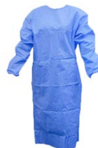
Bata Desechable para visita (Manga Larga) PAAI

Precio: $54.17 SKU: T-BCM-RJ Presentación: Pieza