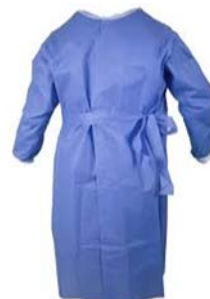
Bata desechable estéril 50 gr PAAI Precio: $87.7 SKU: T-BATES001 Presentación: Pieza