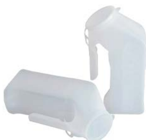
Orinal traslucido con tapa PAAI Precio: $26.56 SKU: T-H140-01 Presentación: Pieza