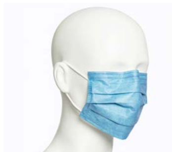
Cubreboca alta filtración con orejeras CS CBO006-02 MEDPOL Precio: $64.5 SKU: T-CBO006-02 Presentación: 50 pzas