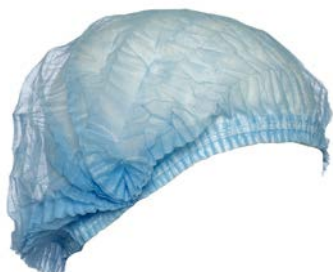
Gorro Paciente GPE 100 PAAI Precio: $123.66 SKU: T-GPE0100 Presentación: 100 pzas