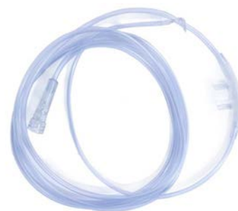
Cánula nasal adulto 15 mts 100% Silicón UNILEBEN

Precio: $12.76 SKU: T-CNA018 Presentación: Pieza