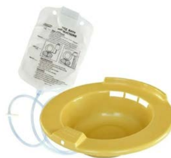
Tina p/hemorroide (Sediluvio) AMSINO Precio: $154.28 SKU: T-H990-05 Presentación: Pieza