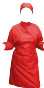
Bata de cirujano roja estéril PAAI

Precio: $63.68 SKU: T-BPSB-02 Presentación: Pieza