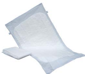
Protector Clínico PAAI Precio: $12.88 SKU: T-012 Presentación: Pieza