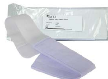
Fijador para sonda Foley PAAI Precio: $62.29 SKU: T-FSF Presentación: Pieza