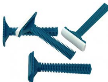
Rastrillo para tricotomía RZPTU01 AMSINO Precio: $16.12 SKU: T-RZPTU01 Presentación: Pieza