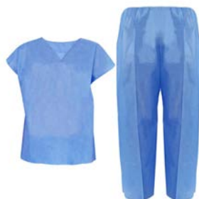
Uniforme QX desechable 40 gr resorte PAAI con bolsa en filipina y pantalón, cuello con bias y pantalón con resorte Precio: $471.54 SKU: T-UQD10 Presentación: 100 pzas