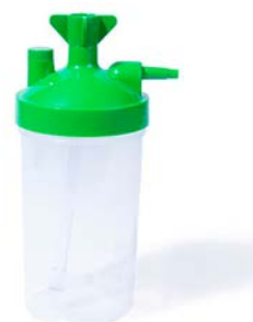
Humidificador de burbuja 500 ml UNILEBEN

Precio: $33.76 SKU: T-CNA18 Presentación: Pieza