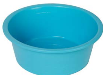
Lebrillo de plástico redondo PAAI Precio: $26.1 SKU: T-LPR006 Presentación: Pieza