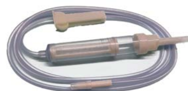
Equipo para transfusión de sangre transfuset UNILEBEN Precio: $16.01 SKU: T-TRANSF Presentación: Pieza