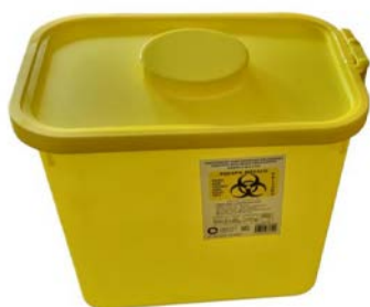
Recolector de líquidos amarillo IXIÓN 8.5 lt Precio: $113.66 SKU: T-REC003 Presentación: Pieza