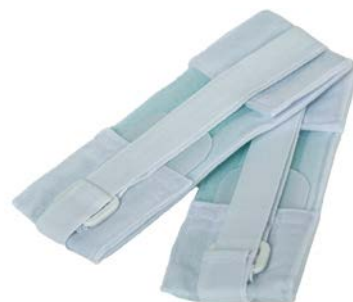
Sujetador para extremidades adulto PAAI Precio: $84.33 SKU: T-SEA Presentación: Pieza