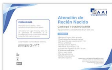
Kit Recepción de Bebé PAAI Precio: $429.66 SKU: T-MMP-801 Presentación: Pieza