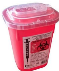
Recolector de punzocortantes Rojo IXIÓN 1 lt Precio: $41.3 SKU: T-CONTIL Presentación: Pieza