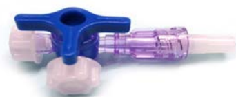
Llave 3 vías sin tubo de extensión UNILEBEN Precio: $17.4 SKU: T-K19 Presentación: Pieza