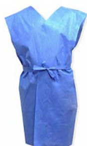
Bata desechable para paciente sin mangas PAAI

Precio: $214.6 SKU: T-BPM034 Presentación: 10 pzas