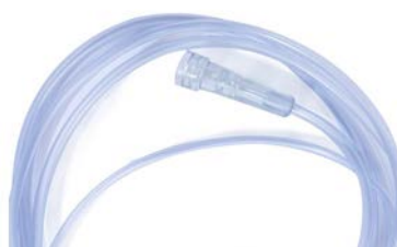
Extension oxiset 1.5 mts UNILEBEN

Precio: $44.66 SKU: T-VHOXI Presentación: Pieza