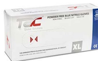
Guante de exploración NO estéril nitrilo TAC CH M G Precio: $180.5 SKU: T-GNCS02 Presentación: Caja 100