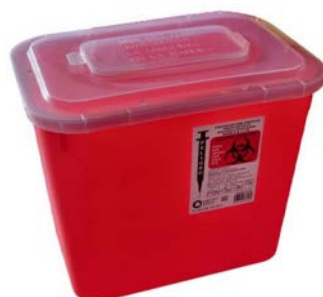
Recolector de punzocortantes Rojo IXIÓN 8 lt Precio: $109.35 SKU: T-PC85 Presentación: Pieza