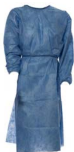
Bata desechable manga larga 40 gr PAAI Precio: $429.78 SKU: T-BTML10 Presentación: 10 piezas