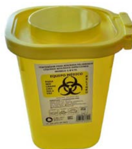
Recolector de líquidos amarillo IXIÓN 1.8 lt Precio: $56.23 SKU: T-REC001 Presentación: Pieza