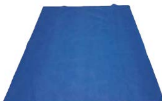
Fundas de mayo individual estéril PAAI Precio: $34.80 SKU: T-FMI001 Presentación: Pieza