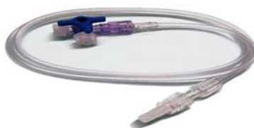
Llave 3 Vías con extensión 80 cm UNILEBEN Precio: $20.76 SKU: T-VIASET Presentación: Pieza