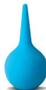
Jeringa pera de hule No.5 ARFAM Precio: $29.35 SKU: T-PDH06 Presentación: Pieza