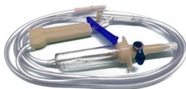
Equipos uniset microgotero UNILEBEN Precio: $12.41 SKU: T-MICROG Presentación: Pieza