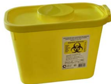
Recolector de líquidos ama- rillo IXIÓN 4 lt Precio: $75.18 SKU: T-REC002 Presentación: Pieza