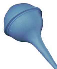
Jeringa pera de hule estéril No.4 AMSINO Precio: $25.29 SKU: T-AS00502S Presentación: Pieza