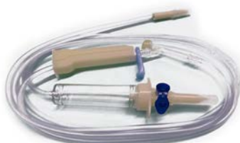
Equipos uniset normogotero UNILEBEN Precio: $14.73 SKU: T-NORMO Presentación: Pieza