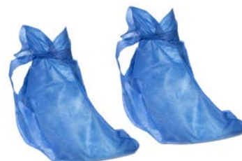
Bota para cirujano desechable PAAI Precio: $95 SKU: T-BCD010 Presentación: 25 pares